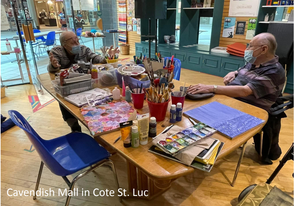
Cavendish Mall in Cote St. Luc