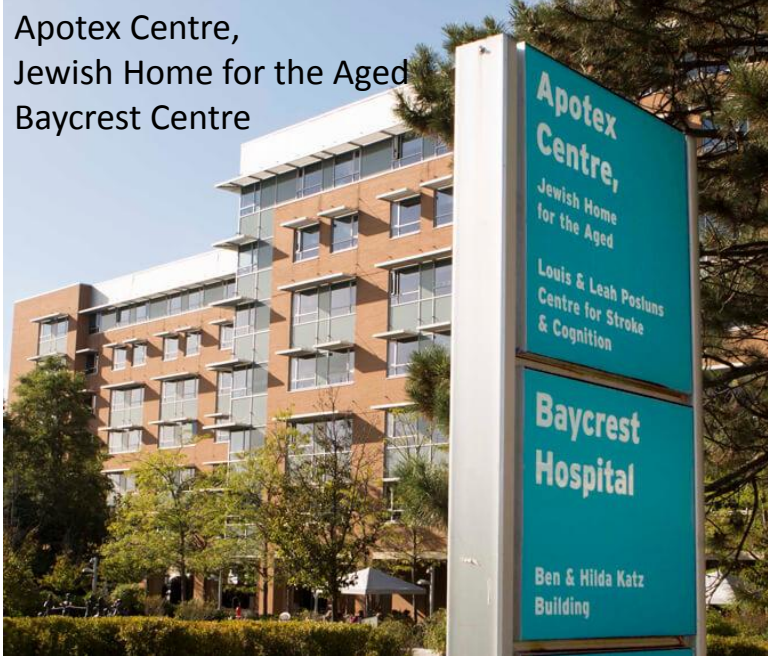
Apotex Centre, Jewish Home for the Aged Baycrest Centre