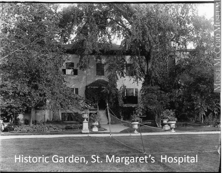
Historic Garden, St. Margaret's Hospital