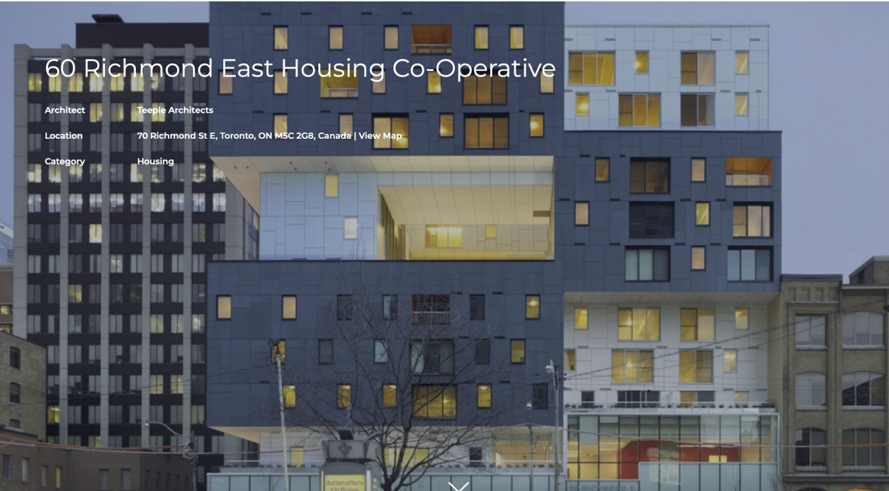
60 Richmond East Housing Co-Operative

Architect Teeple Architects Location 70 Richmond St E, Toronto, ON M5C 2G8, Canada | View Map Category Housing